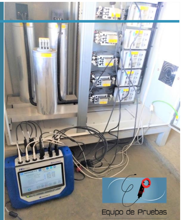
Equipo de Pruebas