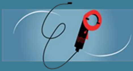
Equipo de Pruebas